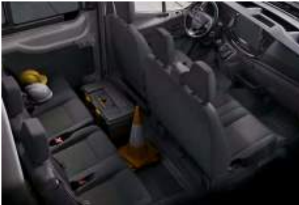
4. OSOBOWA ŁAWKA W 2. RZĘDZIE SIEDZEŃ Opcja dostępna tylko dla wersji Brygadowy 350 L3