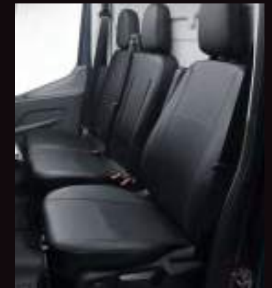
TAPICERKA VINYLOWA PAKIET 4A DLA WERSJI VAN