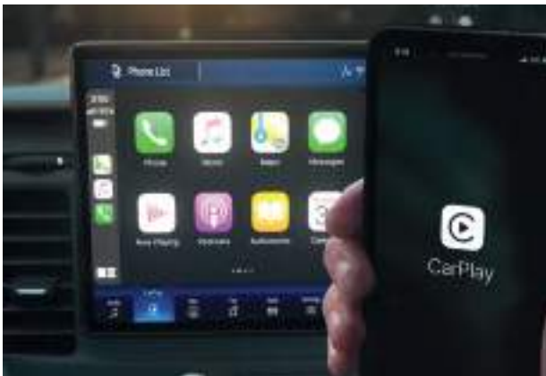
BEZPRZEWODOWA OBSŁUGA APPLE CARPLAY I ANDROID AUTO Standard dla wszystkich wersji. Wymaga kompatybilnego urządzenia.