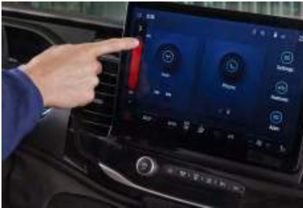
SYSTEM MULTIMEDIALNY SYNC 4 Z 12" EKRANEM DOTYKOWYM Standard dla wszystkich wersji