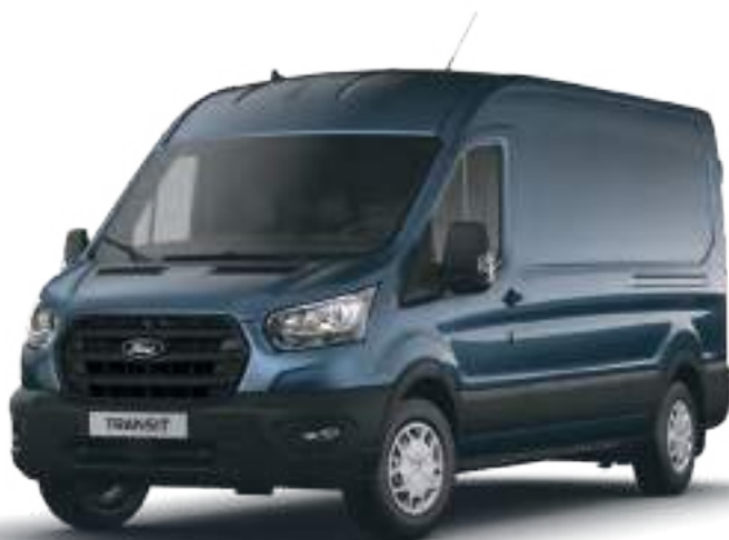
Nowy Ford Transit w wersji Trend L3H2 z lakierem metalizowanym Chrome Blue (opcja)