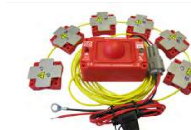
K&K - ODSTRASZACZ KUN M4700 - URZĄDZENIE WIELOFUNKCYJNE (2 033 208) 961 Zł