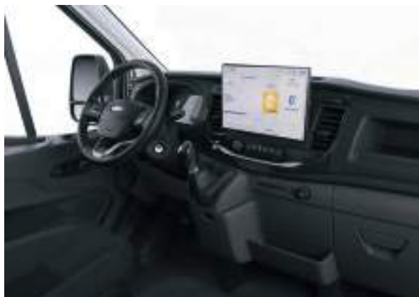
Nowy Ford Transit w wersji Trend z tapicerką materiałową (standard)