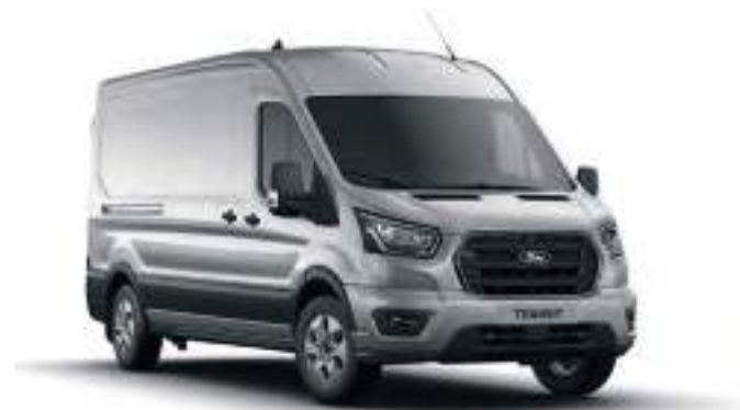
MOONDUST SILVER - LAKIER METALIZOWANY 2 200 zł