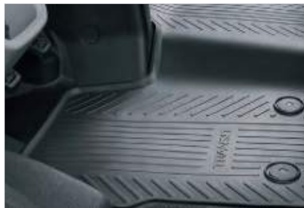
DYWANIKI PODŁOGOWE, GUMOWE - PRZÓD (2 021 104) 273 Zł