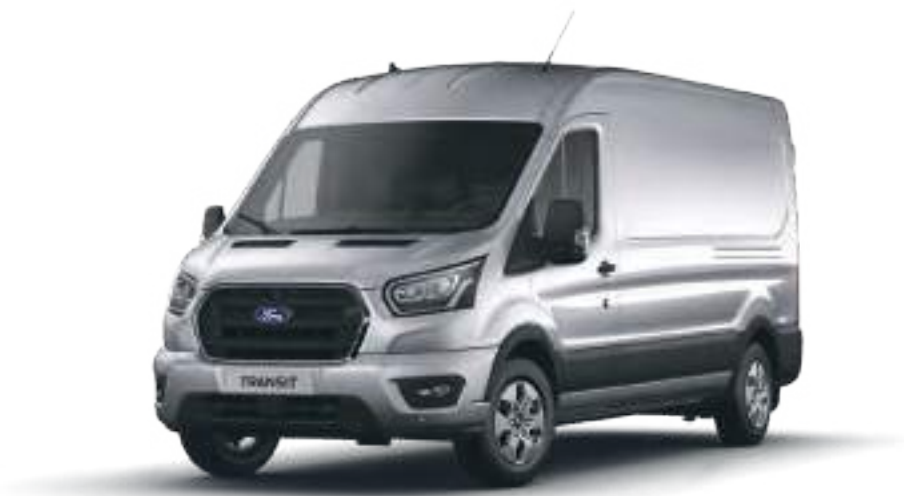
Nowy Ford Transit w wersji Limited L3H2 z lakierem metalizowanym Moondust Silver (opcja)