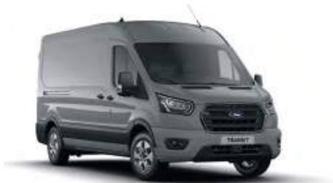
GREY MATTER - LAKIER SPECJALNY 2 200 zł