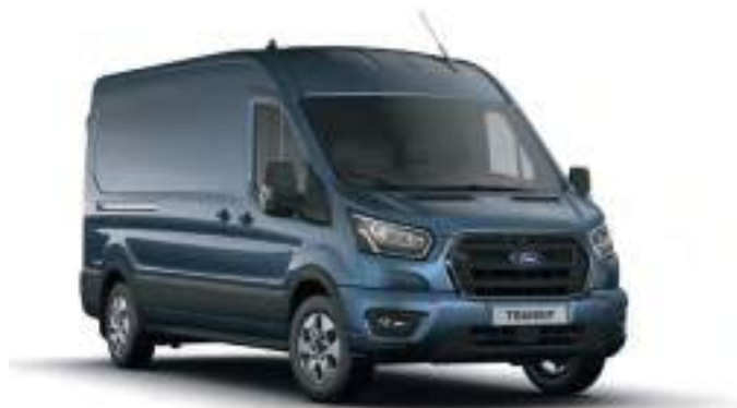
CHROME BLUE - LAKIER METALIZOWANY 2 200 zł