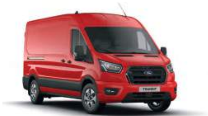
RACE RED - LAKIER ZWYKŁY bez dopłaty