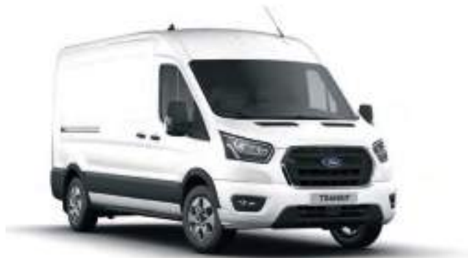
FROZEN WHITE - LAKIER ZWYKŁY bez dopłaty