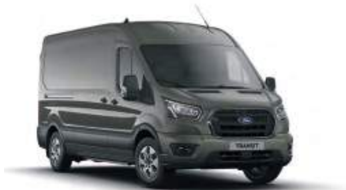
MAGNETIC - LAKIER METALIZOWANY 2 200 zł