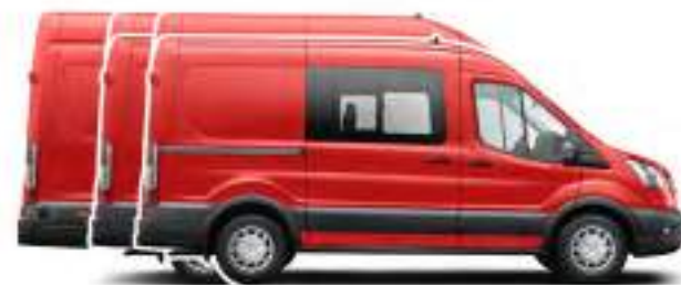
BRYGADOWY Dostępne rodzaje nadwozia