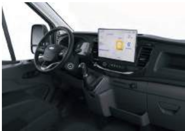
Nowy Ford Transit w wersji Limited z tapicerką materiałową (standard)