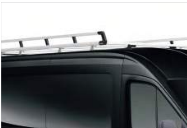
Q-TOP® KOSZ BAGAŻOWY (2 485 864) 6 101 P LN