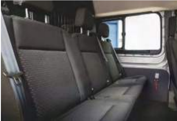
3. OSOBOWA ŁAWKA W 2. RZĘDZIE SIEDZEŃ Standard dla wersji Brygadowy