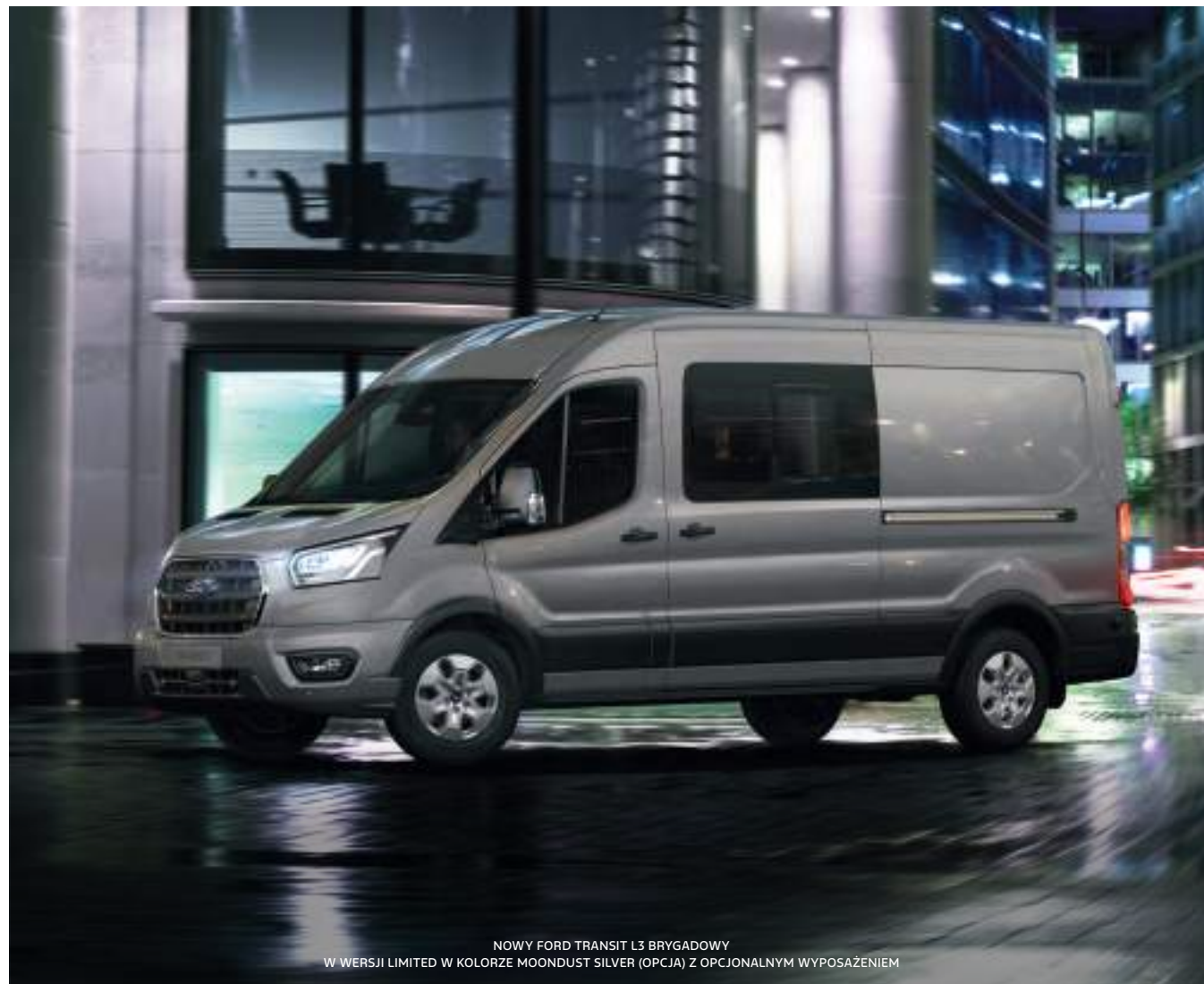
NOWY FORD TRANSIT L3 BRYGADOWY W WERSJI LIMITED W KOLORZE MOONDUST SILVER (OPCJA) Z OPCJONALNYM WYPOSAŻENIEM