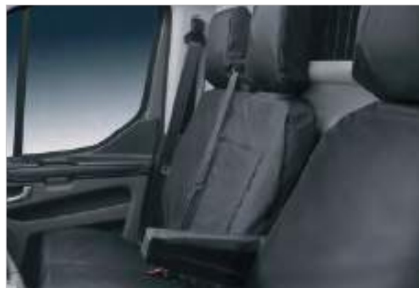
POKROWIEC NA PODWÓJNY FOTEL PASAŻERA, CZARNY (2 326 822) 391 Zł