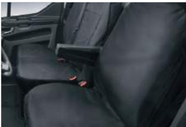
POKROWIEC NA FOTEL KIEROWCY (2 326 838) 250 Zł