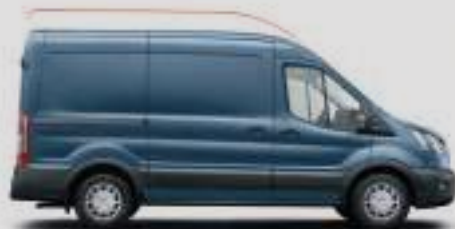
VAN L2H2 / L2H3