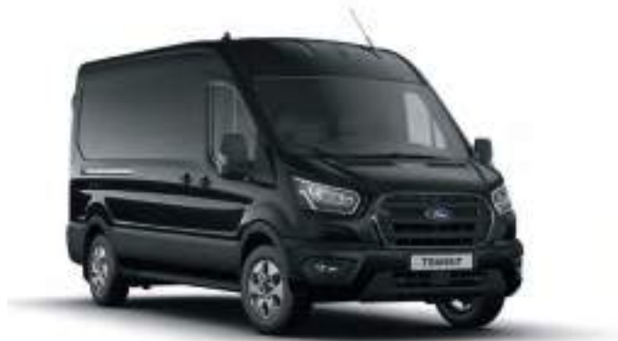
AGATE BLACK - LAKIER METALIZOWANY 2 200 zł