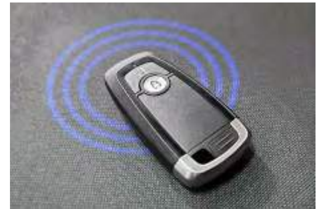
FORD KEYFREE - centralny zamek z kluczem elektronicznym Opcja dla wszystkich wersji