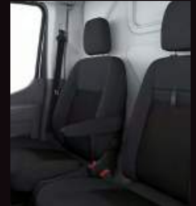
TAPICERKA MATERIAŁOWA STANDARD DLA WERSJI TREND I LIMITED

* Dla wersji Trend z napędem elektrycznym (E-Transit) - standardem jest pakiet 8A. ** Dla wersji Trend poduszka powietrzna pasażera dostępna tylko dla serii 310 i 350