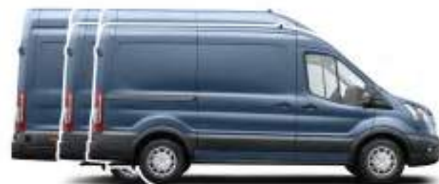
VAN Dostępne rodzaje nadwozia

NOWY FORD TRANSIT VAN W WERSJI LIMITED WERSJA L3H2 W KOLORZE CHROME BLUE (OPCJA)