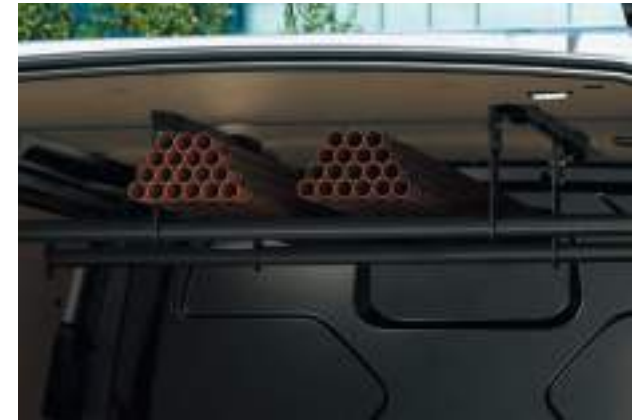
BAGAŻNIK PODSUFITOWY Opcja dla wersji VAN