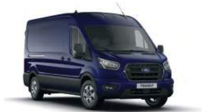
BLAZER BLUE - LAKIER ZWYKŁY bez dopłaty