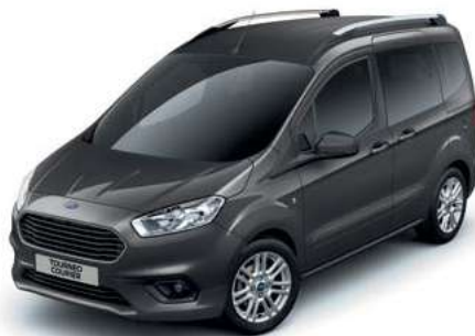
MAGNETIC GREY - lakier metalizowany 1 538,-