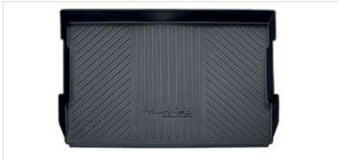
Mata antypoślizgowa do bagażnika czarna (350 552)

Z logo Tourneo Courier, tył i bok wysokość 50 mm