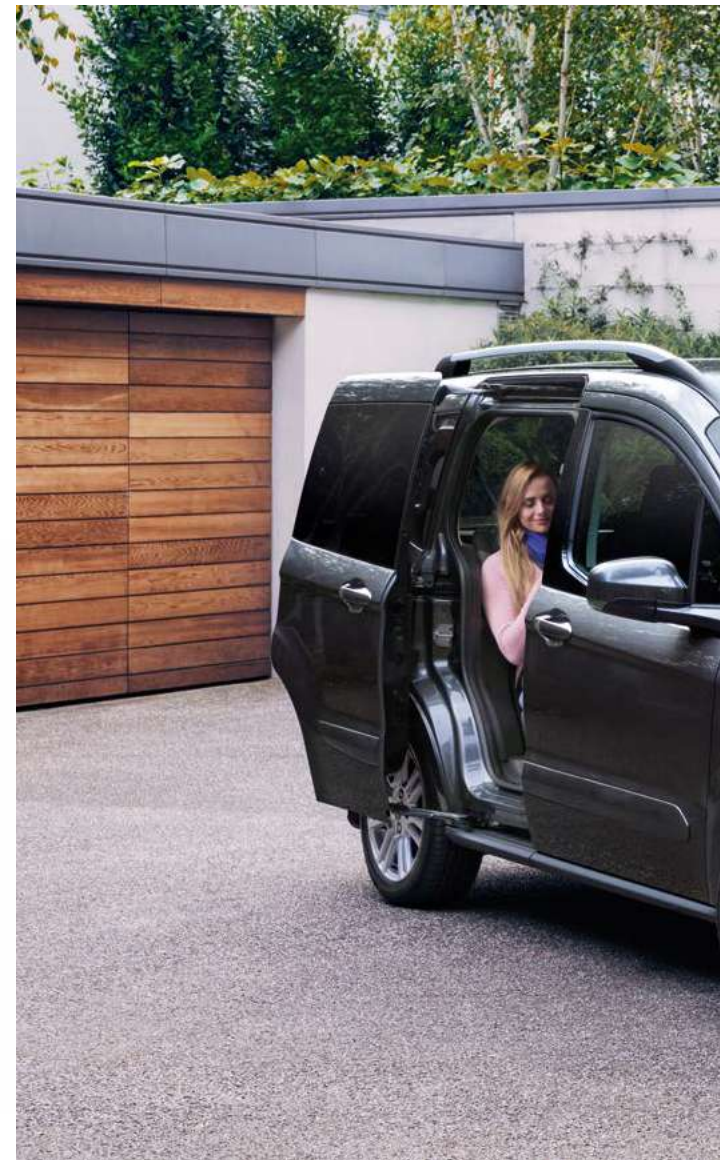
Ford Tourneo Courier Titanium w kolorze Magnetic Grey (opcja)

Wszystkie silniki wyposażone są w Auto-Start-Stop. Wszystkie silniki wysokoprężne wyposażone są w filtr cząstek stałych DPF. Wszystkie silniki wysokoprężne wymagają stosowania płynu AdBlue. Wszystkie silniki spełniają normę emisji spalin Euro 6.2.