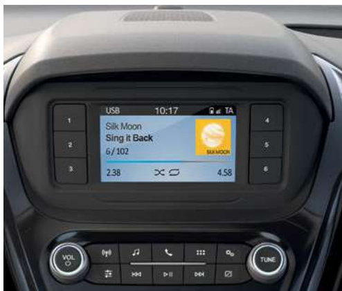
Radio z Ford SYNC 3 Lite i 4" kolorowym ekranem TFT