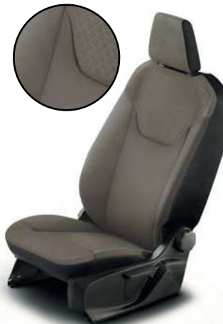
QUADRO - tapicerka materiałowa jasna