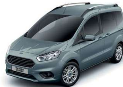
METAL BLUE - lakier metalizowany 1 907,- | lakier niedostępny dla wersji Sport