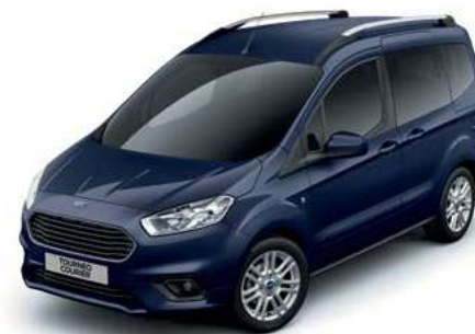
BLAZER BLUE - lakier zwykły bez dopłaty | lakier niedostępny dla wersji Sport