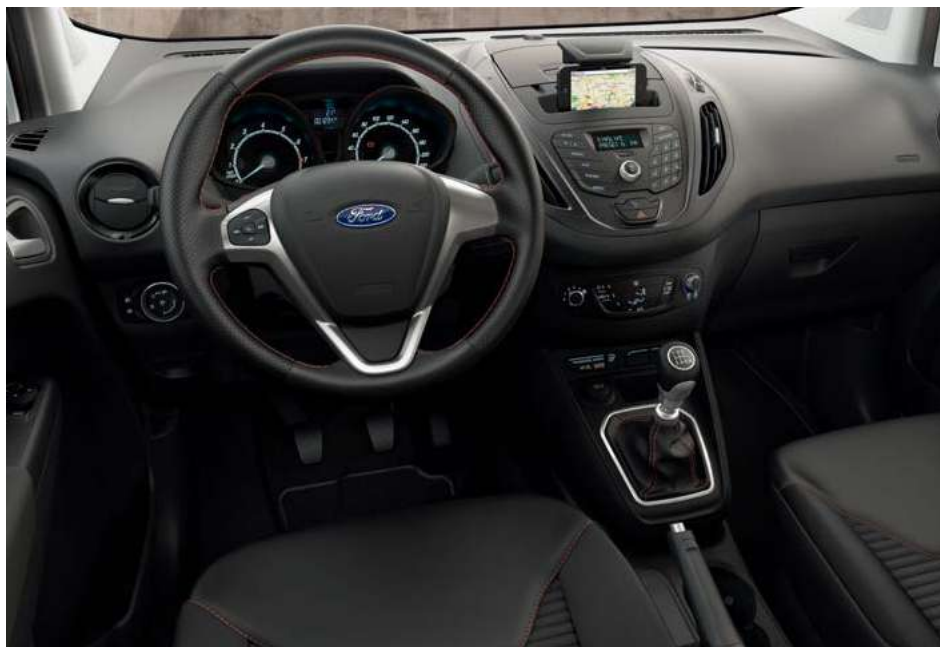
Ford Transit Courier Trend