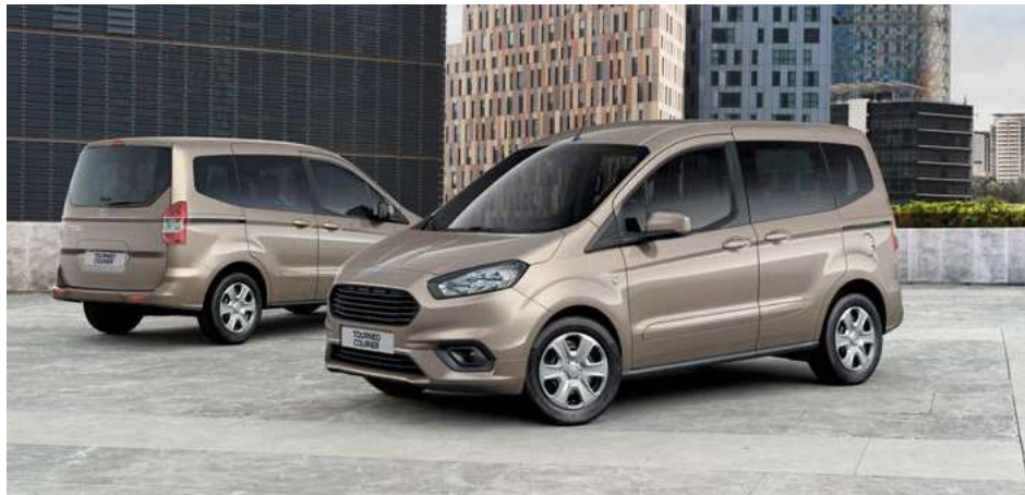
Ford Tourneo Courier Trend w kolorze Diffused Silver (opcja)