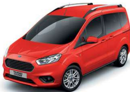
RACE RED - lakier zwykły bez dopłaty