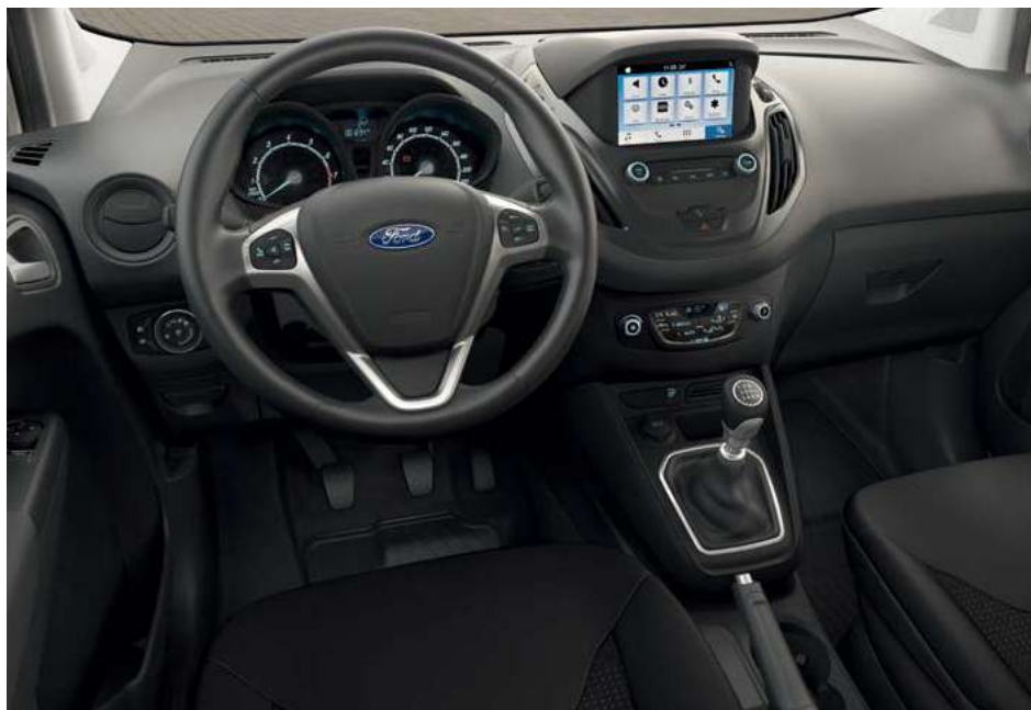
Ford Transit Courier Titanium