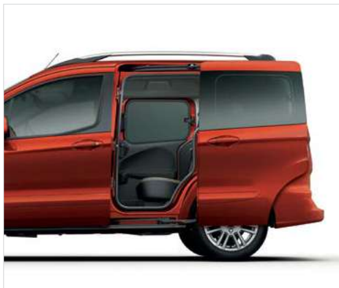
Drzwi boczne odsuwane - obustronnie