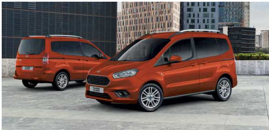
Ford Transit Courier Titanium w kolorze Red Rush (opcja)