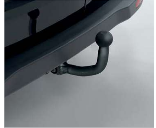
Brink®* Hak holowniczy zamocowany na stałe (1 923 539)

Tylko w połączeniu z zestawem elektrycznym przeznaczonym do danego modelu