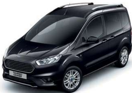
AGATE BLACK - lakier metalizowany 1 538,-