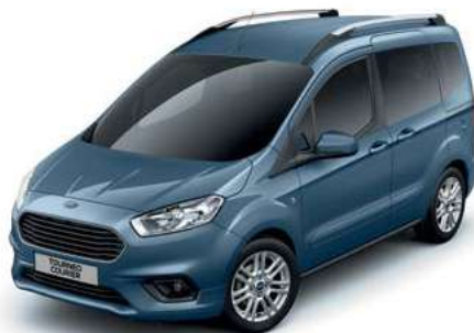
CHROME BLUE - lakier metalizowany 1 538,-