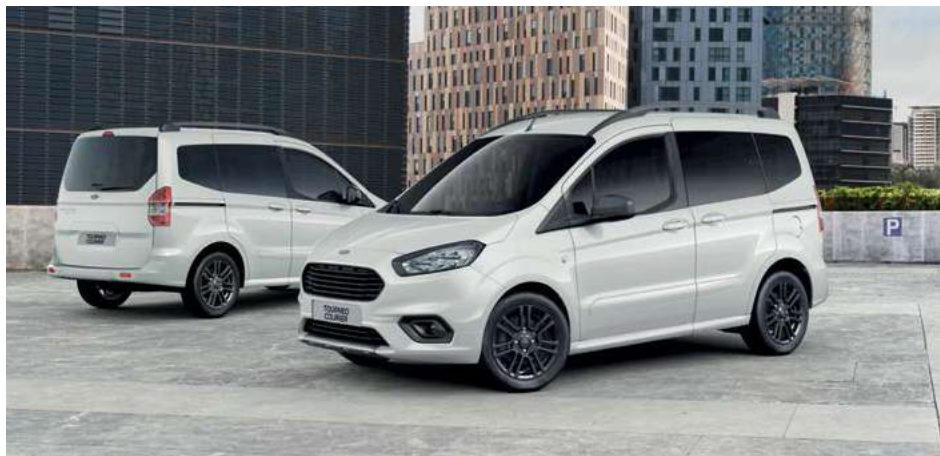
Ford Tourneo Courier Sport w kolorze Frozen White (bez dopłaty)