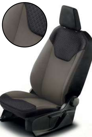
QUADRO - tapicerka materiałowa z ciemnymi akcentami