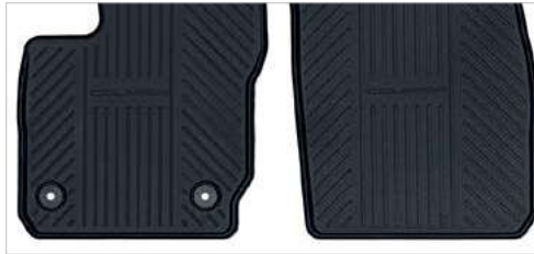
Dywaniki podłogowe, gumowe czarne - przód (2 424 114)

Zestaw 2 szt. z logo Courier oraz z mocowaniami po stronie kierowcy i pasażera oraz ochronę przed wszelkimi warunkami atmosferycznymi.