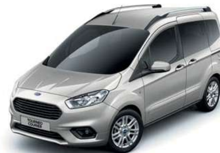
MOONDUST SILVER - lakier metalizowany 1 538,- | lakier niedostępny dla wersji Sport