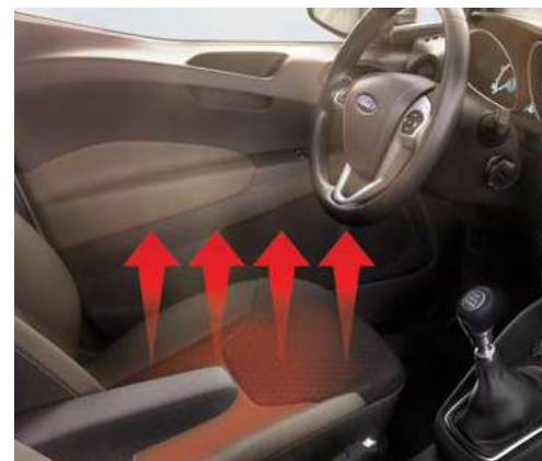
Podgrzewane przednie fotele