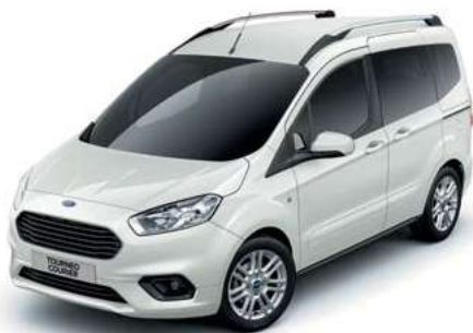
FROZEN WHITE - lakier zwykły bez dopłaty