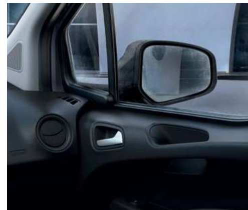
Lusterka boczne sterowane i podgrzewane elektrycznie