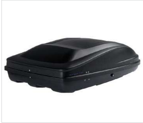
G3* Box dachowy Elegance Europe 330, czarny matowy (2 191 625)

1440 x 860 x 375 mm, 330 l, z funkcją otwierania obustronnego i centralnym zamkiem, waga do 10 kg, maksymalna ładowność 75 kg