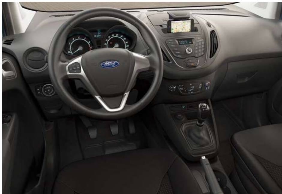
Ford Transit Courier Trend