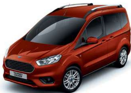
RED RUSH - lakier metalizowany 1907,- | lakier niedostępny dla wersji Sport