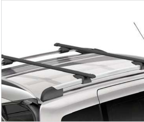
Drążki poprzeczne do fabrycznych relingów (1 889 893)

Maksymalna ładowność 45 kg. Wymagają montażu relingów dachowych (jeżeli nie są montowane fabrycznie)