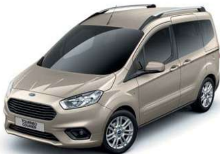
DIFFUSED SILVER - lakier metalizowany 1 907,- | lakier niedostępny dla wersji Sport