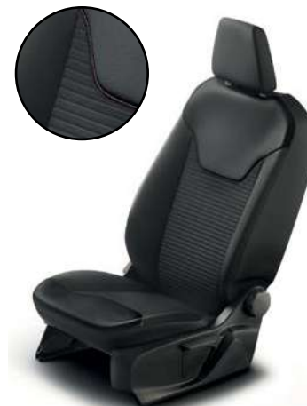
GROOVE - tapicerka częściowo skórzana