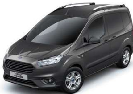
MAGNETIC GREY - lakier metalizowany 1 250,-