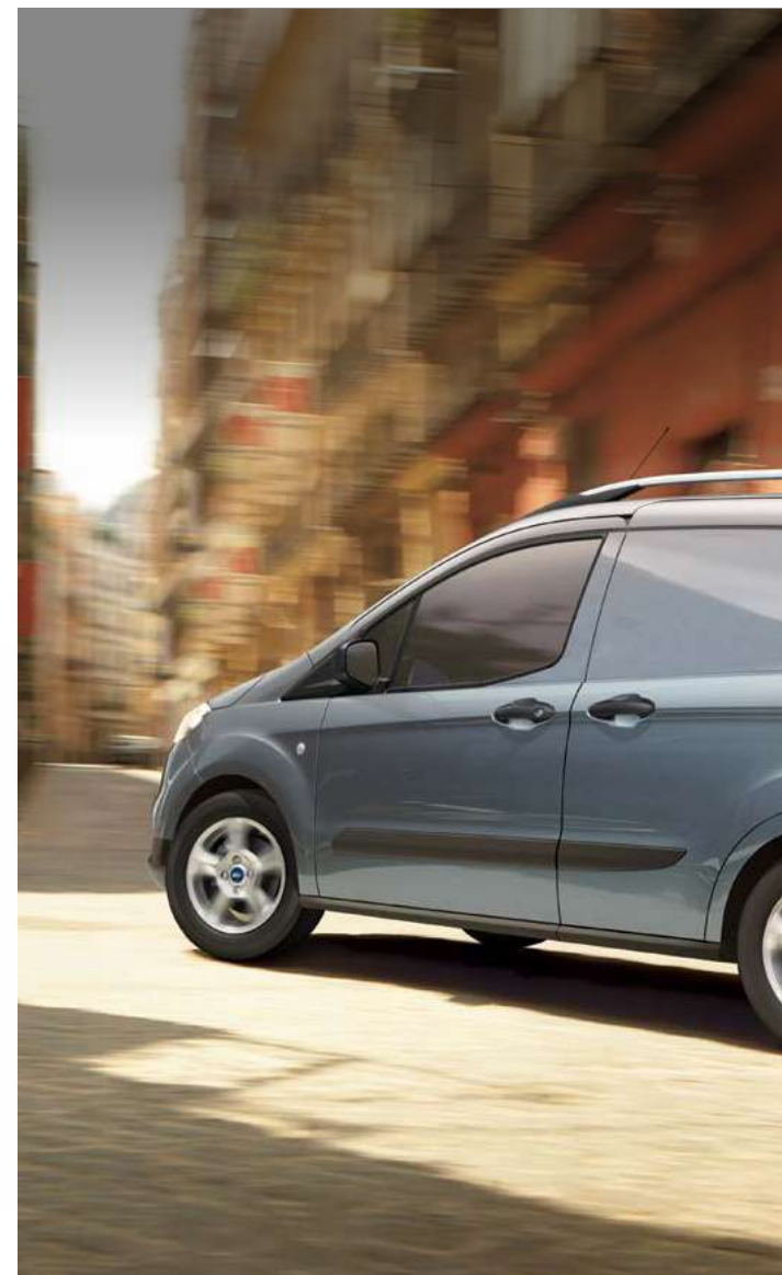
Ford Transit Courier Trend w kolorze Metal Blue (opcja), z opcjonalnym wyposażeniem

Wszystkie silniki wyposażone są w Auto-Start-Stop. Wszystkie silniki wysokoprężne wyposażone są w filtr cząstek stałych DPF. Wszystkie silniki wysokoprężne wymagają stosowania płynu AdBlue. Wszystkie silniki spełniają normę emisji spalin Euro 6.2.