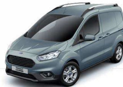
METAL BLUE - lakier metalizowany 1 250,- | lakier niedostępny dla wersji Sport