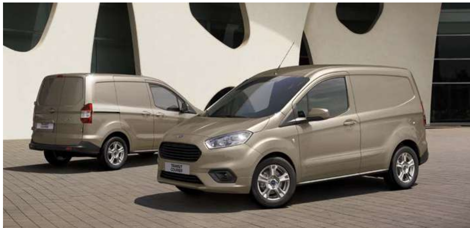
Ford Transit Courier Limited w kolorze Diffused Silver (opcja)