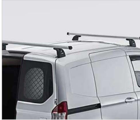
Thule®* Bagażnik dachowy podstawowy do wersji bez relingów (1 582 847)

Maksymalna ładowność 60 kg. Montaż możliwy tylko z zestawem montażowym bagażnika dachowego Thule® 3140 i zestawem uchwytów do bagażnika Thule® 751 (zestaw 4 szt. uchwytów)