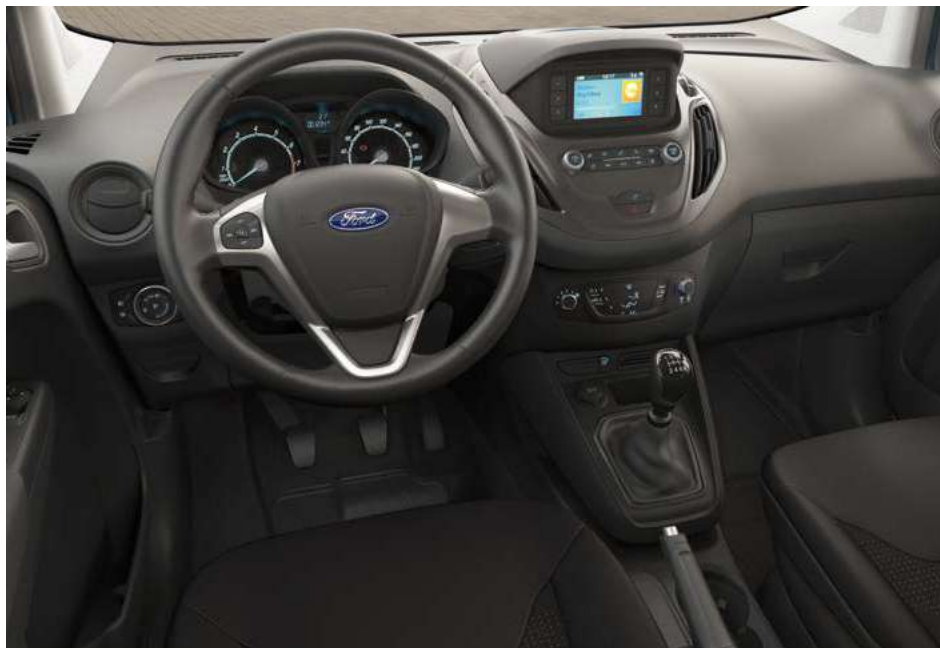
Ford Transit Courier Limited