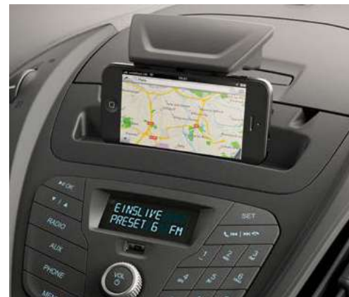
Radio cyfrowe MyConnection z Bluetooth i stacją dokującą MyFord Dock