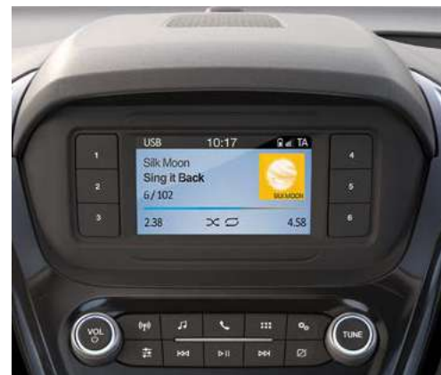
Radio cyfrowe z Ford SYNC 3 Lite i 4" kolorowym ekranem TFT