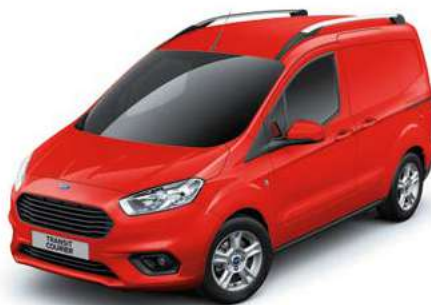
RACE RED - lakier zwykły bez dopłaty