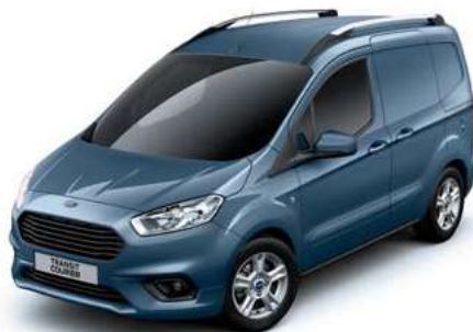
CHROME BLUE - lakier metalizowany 1 250,-