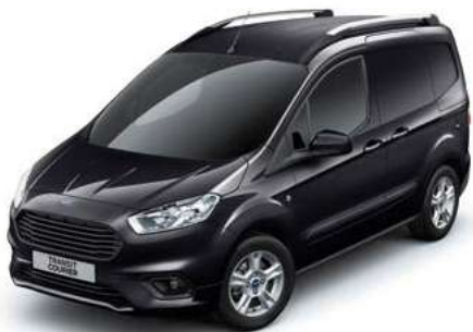
AGATE BLACK - lakier metalizowany 1 250,-