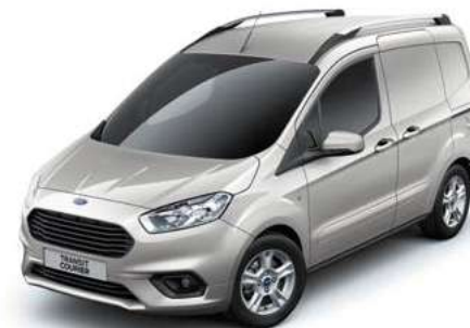
MOONDUST SILVER - lakier metalizowany 1 250,-