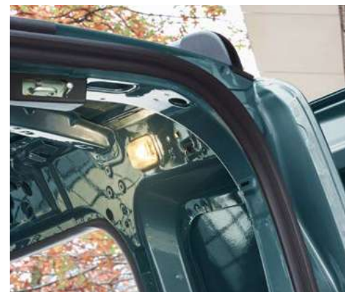
Oświetlenie przedziału ładunkowego LED