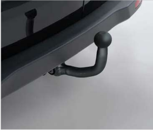
Brink®* Hak holowniczy zamocowany na stałe (1 923 539)

Tylko w połączeniu z zestawem elektrycznym przeznaczonym do danego modelu