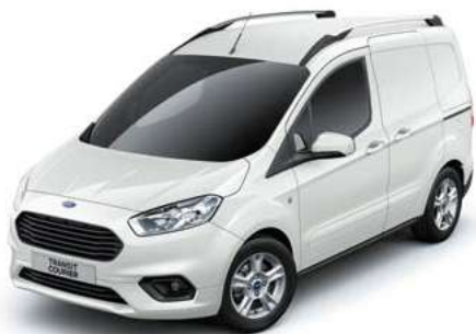
FROZEN WHITE - lakier zwykły bez dopłaty