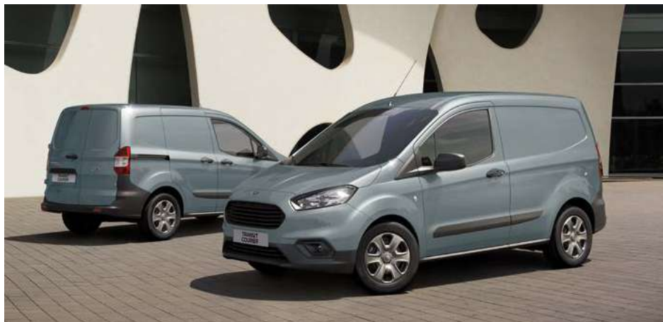
Ford Transit Courier Trend w kolorze Metal Blue (opcja)