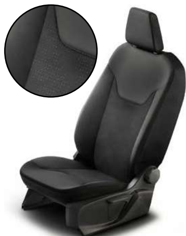
BABILON - tapicerka materiałowa