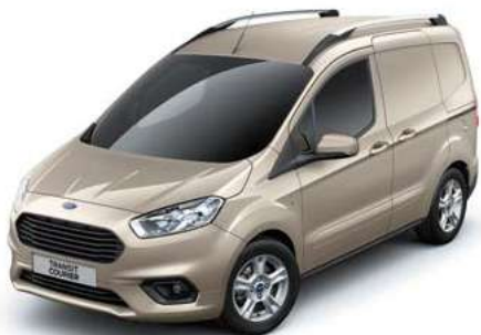
DIFFUSED SILVER - lakier metalizowany 1 250,- | lakier niedostępny dla wersji Sport