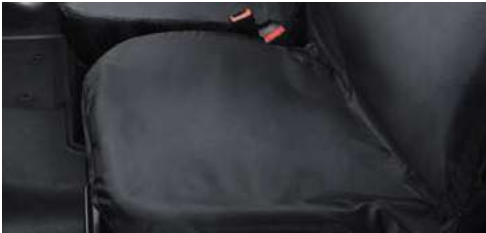
Pokrowiec na fotele na fotel kierowcy, czarny (2 326 846)

Wykonany z poliestru z 100% wodo- i ognioodporną podszewką poliestrową, zszyty nicią spadochronową w celu wzmocnienia trwałości miejsc łączenia materiału