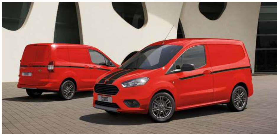
Ford Transit Courier Sport w kolorze Race Red (bez dopłaty)