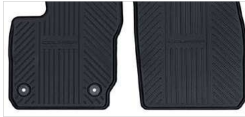
Dywaniki podłogowe, gumowe czarne - przód (2 424 114)

Zestaw 2 szt. z logo Courier oraz z mocowaniami po stronie kierowcy i pasażera oraz ochronę przed wszelkimi warunkami atmosferycznymi.