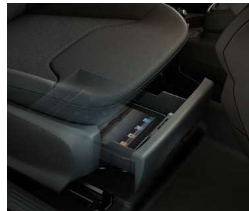
Wysuwane schowki - pod przednimi fotelami