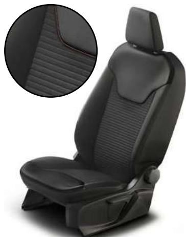
GROOVE - tapicerka częściowo skórzana