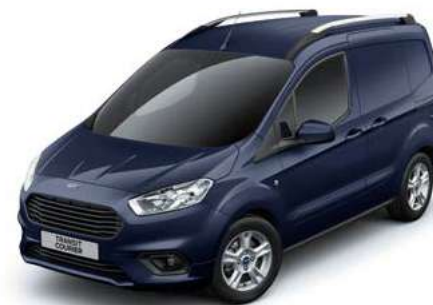
BLAZER BLUE - lakier zwykły bez dopłaty | lakier niedostępny dla wersji Limited i Sport