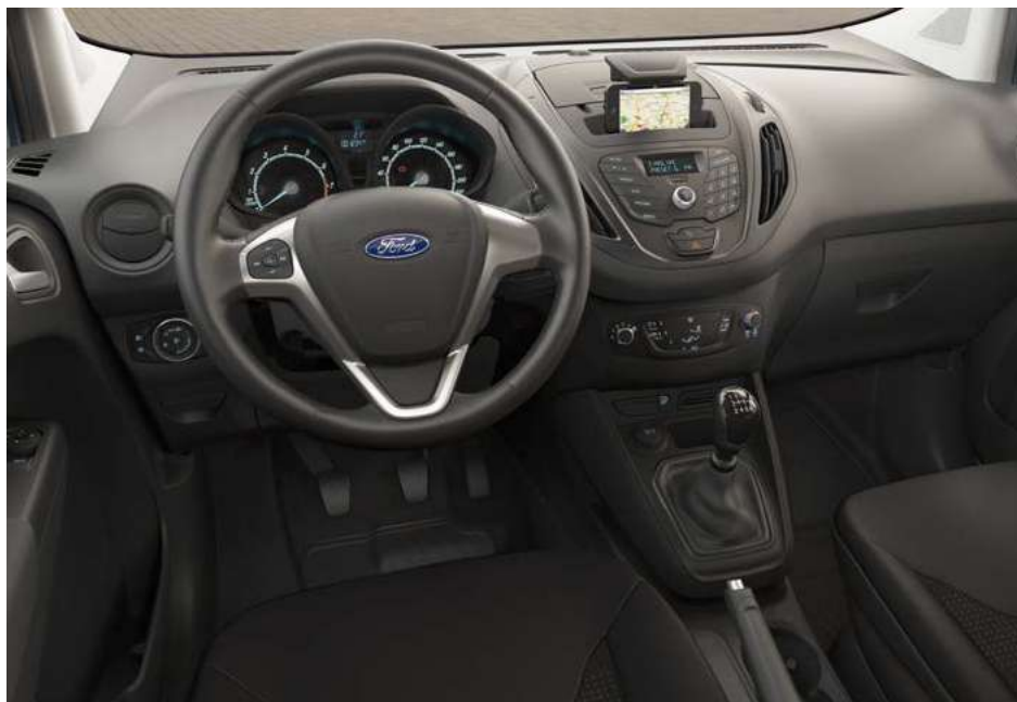
Ford Transit Courier Trend