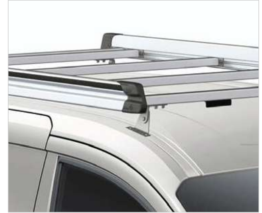
Q-Top® (Q-Tech)* Kosz bagażowy (2 436 821)

Mocny i trwały, aluminium, 2000 mm x 1300 mm, waga około 22 kg, maksymalna ładowność do 100 kg (z koszem)