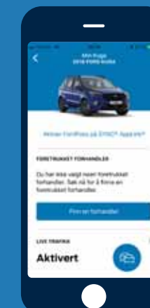
Kontakt din Ford- forhandler og FordPass-guider

Med FordPass kan du finne bensinstasjoner, parkeringsplasser m.m. og sende disse lokasjonene til ditt SYNC 3 navigasjonssystem. Du kan få tilgang til viktig informasjon om bilens tilstand, samt komme i kontakt med din Ford-forhandler.