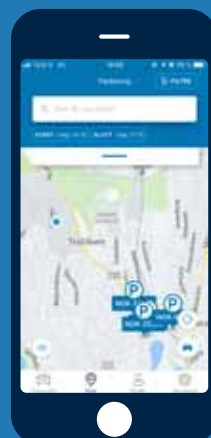
Parkering og bensinstasjoner