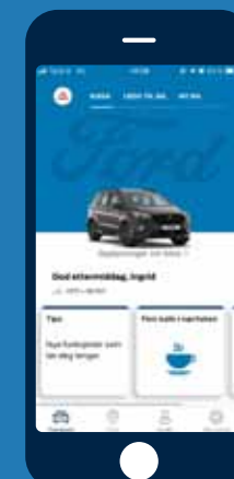
Wi-Fi hotspot* * Tilgjengelig fra 2019