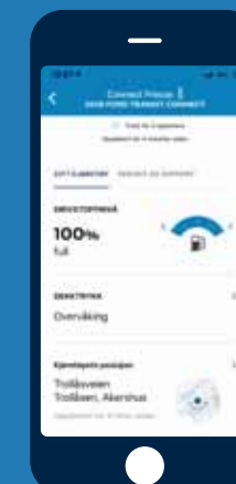
Informasjon om bilens tilstand