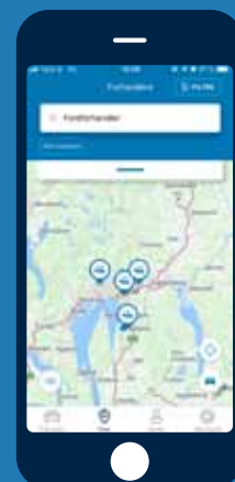
Send destinasjon til bilen