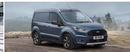
Trend Standard felszereltség Belső kialakítás