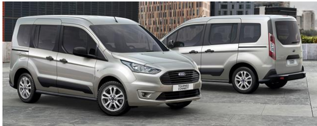
Trend Standard felszereltség Kerekek és gumik

2021.25-ös modellév 2020/5 Érvényes: 2021. március 1-i gyártástól A változtatás jogát fenntartjuk!