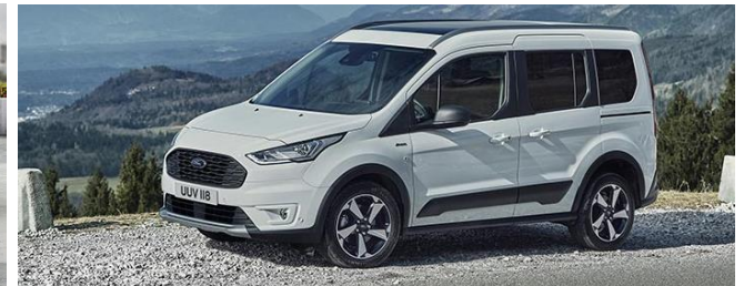
Active Standard felszereltség Titanium szérián felül Kerekek és gumik

6.5X16" 7 küllős alumínium kerekek - 205/60 R16-os gumikkal