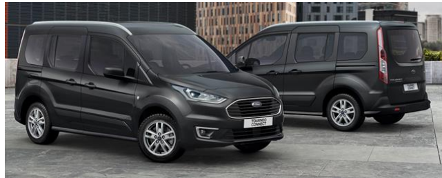
Titanium Standard felszereltség Trend szérián felül Kerekek és gumik