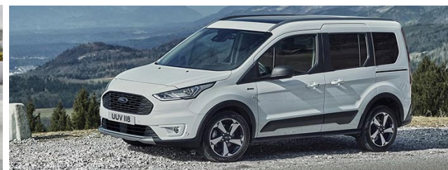
Trend Standard felszereltség Külső megjelenés