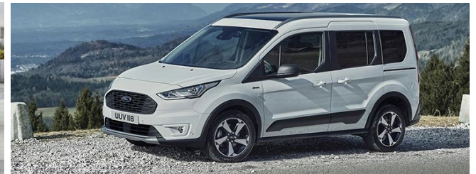
Active Standard felszereltség Titanium szérián felül Kerekek és gumik

6.5X16" 7 küllős alumínium kerekek - 205/60 R16-os gumikkal