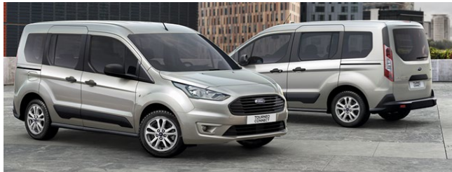
Trend Standard felszereltség Kerekek és gumik

2021.75-ös modellév 2021/1 Érvényes: 2021. április 19-i gyártástól A változtatás jogát fenntartjuk!