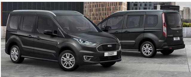
Titanium Standard felszereltség Trend szérián felül

Defektjavító készlet Keréknyomás figyelő rendszer