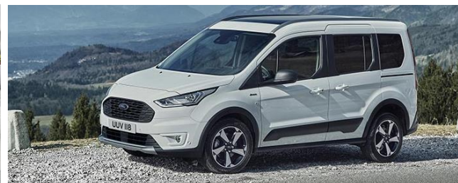
Active Standard felszereltség Titanium szérián felül