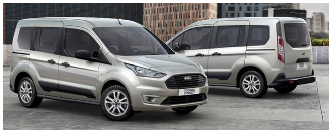
Trend Standard felszereltség

2021.25-ös modellév 2020/3. Érvényes: 2020. október 5-i gyártástól A változtatás jogát fenntartjuk!