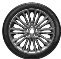
Méret 18" Széria V-line Kategória Standard