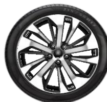
18" Titanium Opció