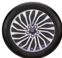
17" Titanium Opció