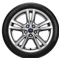
Méret 17" Széria Titanium Kategória Standard

Érvényes: 2021. február 16-i gyártástól A változtatás jogát fenntartjuk!