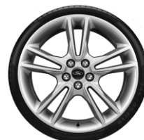
19" Titanium Opció