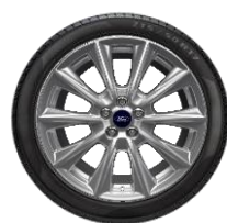
19" V-Line Opció