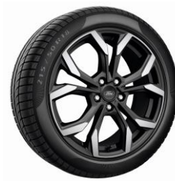
18" ST-Line X Standard