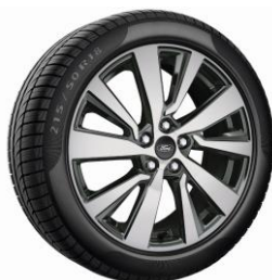
18" Titanium X Standard