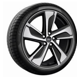
19" ST-Line/ST-Line X Külső Dizájn csomagban érhető el