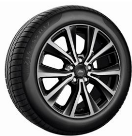
17" Titanium Standard

2021.25-ös modellév - 2020/10 Érvényes: 2020. október 19-i gyártástól A változtatás jogát fenntartjuk!