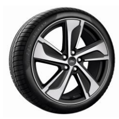
19" ST-Line/ST-Line X Külső Dizájn csomagban érhető el