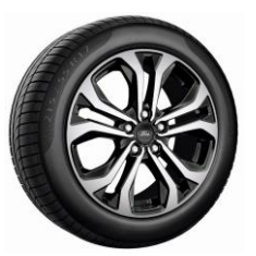
17" ST-Line Standard