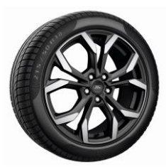
18" ST-Line X Standard